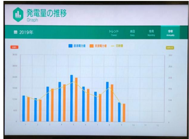
写真4 発電量リアルタイムモニター