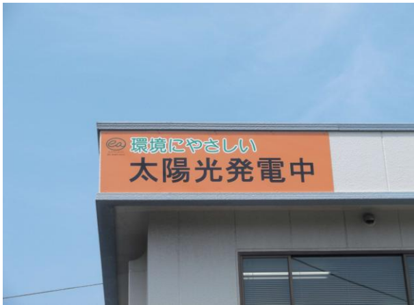
写真3 「太陽光発電中」の看板設置