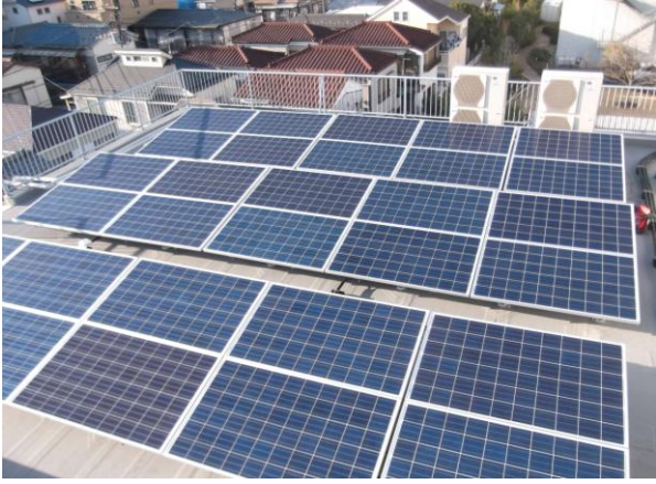
写真1 太陽光パネル①