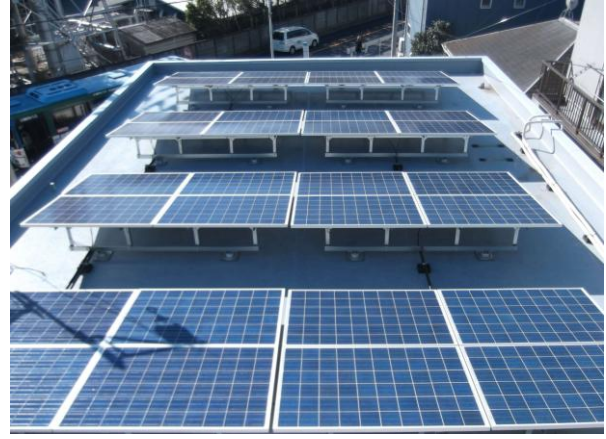
写真2 太陽光パネル②